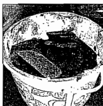
Nachschub für den »Hagelzucker«.