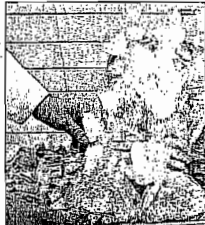
Mehlbolzen vor dem Versand.