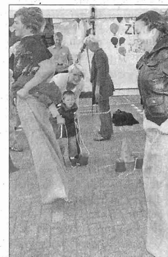
Sackhüpfen ist auch heutzutage noch ein großer Spaß.