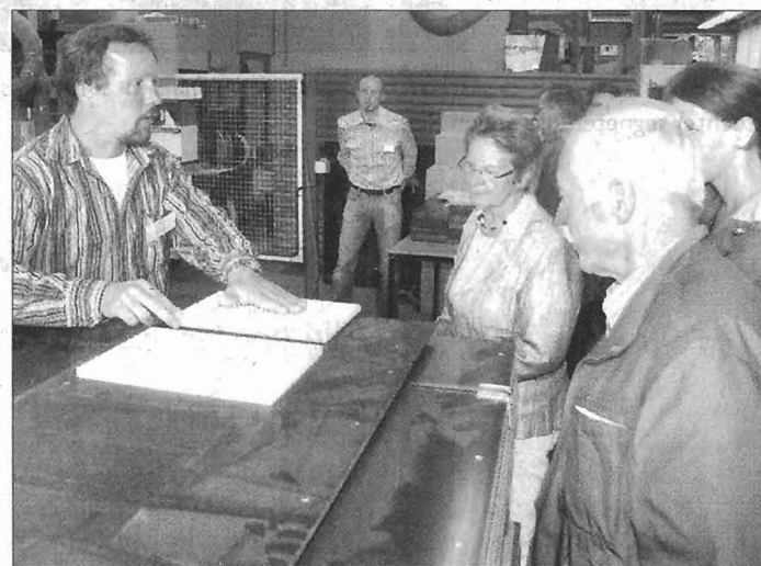
Interessante Einblicke in die verschiedenen Arbeitsbereiche wurden den Besuchern geboten.