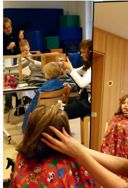
Haarschneideaktion vor Weihnachten

Von den Spenden werden Geräte und Sonderausstattungen angeschafft, die Menschen mit Behinderung Teilhabe am Arbeitsleben ermöglichen.